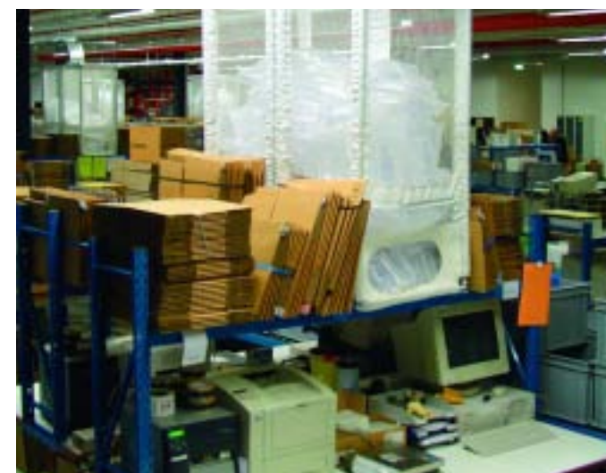
Bunker met gripopening

Een Automatic Delivery System (ADS) transporteert luchtkussens vanaf de machine direkt naar de pakplaats. De MarkII luchtkussenmachine kan worden voorzien van een snijmechanisme, waarmee een keten luchtkussens van gewenste lengte kan worden geproduceerd. Deze lengte wordt afgestemd op het aantal kussens dat het meest wordt gebruikt per verpakking, en kan variëren van 3 tot 20 kussens. De keten luchtkussens wordt vervolgens met behulp van een ventilator via een kanaal naar een opvangbunker geblazen, die boven de paktafel hangt. De verpakker neemt de luchtkussens uit de bunker via een opening aan de onderzijde, en kan deze dan direkt verwerken. In de opvangbunkers zorgen sensoren ervoor dat de machine een signaal krijgt wanneer de bunker moet worden bijgevuld. Dit gebeurt geheel automatisch. Met één machine kunnen meerdere pakplaatsen /bunkers van materiaal worden voorzien.