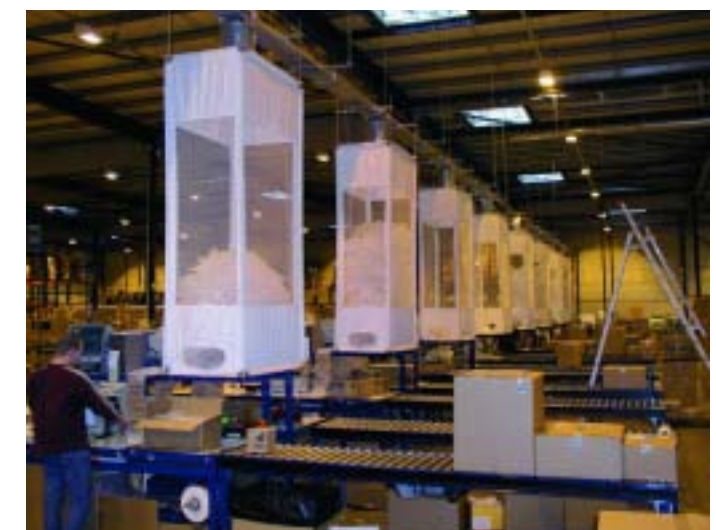
Automatic Delivery System

Een ADS is 100% maatwerk, en kan daarmee worden geïntegreerd in vrijwel elke bestaande logistieke situatie. Dit betekent dat er een eenvoudig systeem kan worden gebouwd voor twee pakplaatsen, maar ook systemen om 30 pakplaatsen met luchtkussens te beleveren. Wij brengen uw logistieke situatie en uw wensen in kaart, en brengen dan advies uit over de beste oplossing.