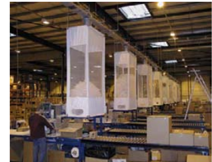
Automatic Delivery System