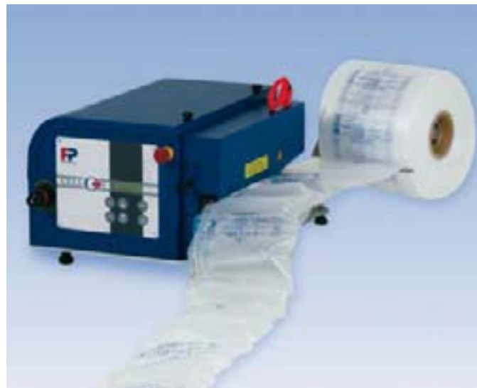
CELL-O EZ luchtkussenmachine

Ook op het gebied van integratie denken wij graag met u mee. Nauwe samenwerking met onze klanten heeft ons geleerd dat naarmate het jaarvolume aan luchtkussens toeneemt, er steeds meer de behoefte ontstaat om de weg tussen de productie van het opvulmateriaal en de pakplaats te minimaliseren, of nog beter, compleet te laten vervallen. Dit is mogelijk middels een Automatic Delivery System (ADS).