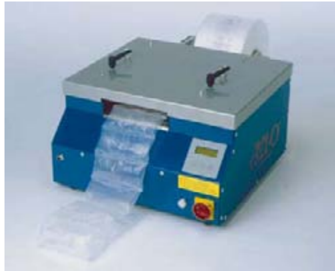
CELL-O MARK II luchtkussenmachine