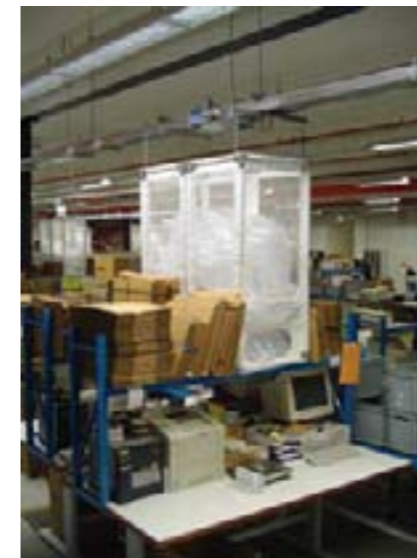
Bunker met gripopening

Een ADS is 100% maatwerk, en kan daarmee worden geïntegreerd in vrijwel elke bestaande logistieke situatie. Dit betekent dat er een eenvoudig systeem kan worden gebouwd voor twee pakplaatsen, maar ook systemen om 30 pakplaatsen met luchtkussens te belevieren. Wij brengen uw logistieke situatie en uw wensen in kaart, en brengen dan advies uit over de beste oplossing.